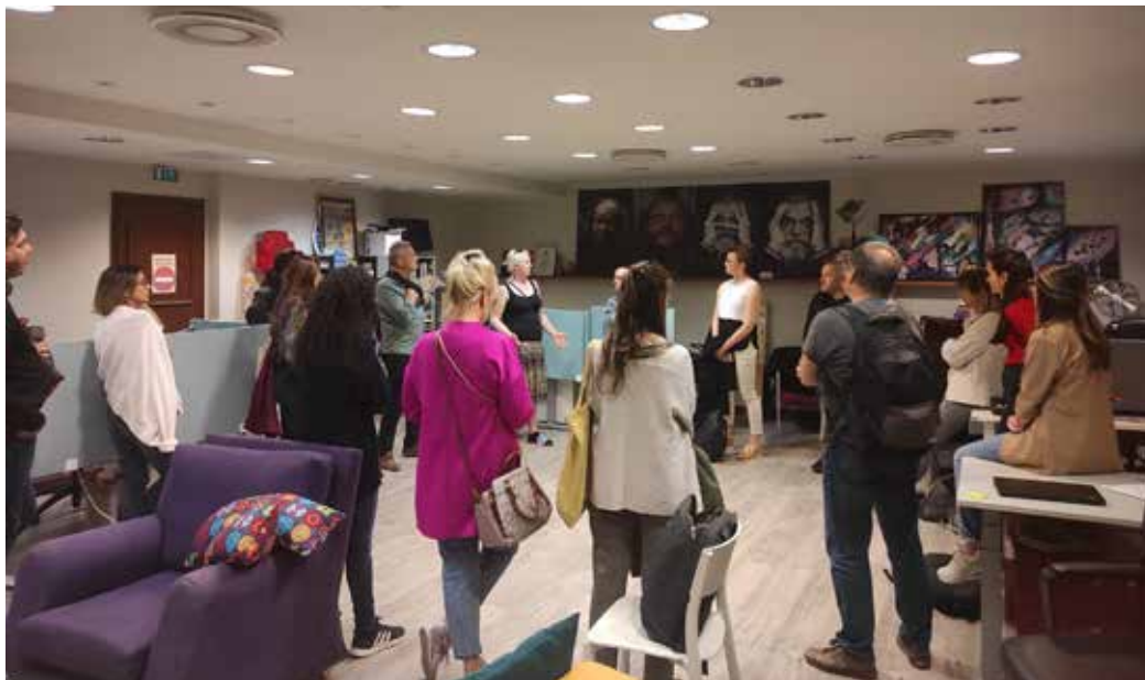
Οι εταίροι του έργου ATL κατά την επίσκεψη στο VEPA

Το Vera, από την άλλη πλευρά, είναι ένα κέντρο όπου οι άστεγοι μπορούν να ξεκουραστούν, να περάσουν χρόνο, να απολαύσουν ένα ζεστό γέυμα, να μιλήσουν για τα προβλήματά τους και να συνδεθούν με τις κατάλληλες υπηρεσίες ώστε να λάβουν τη βοήθεια που χρειάζονται. Έχουν επίσης πρόσβαση σε ρούχα, προϊόντα περιποίησης, καθώς και υπολογιστές και τηλέφωνο για να διεκπεραιώσουν διοικητικές διαδικασίες.