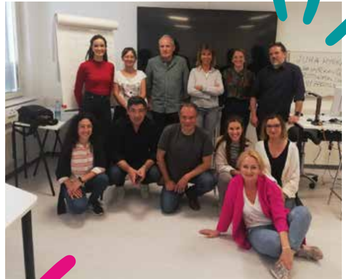
Οι εταίροι του έργου ATL στην 4η Διακρατική Συνάντηση του Έργου στο Ελσίνκι

Οι οργανισμοί-εταίροι συναντήθηκαν στο Ελσίνκι (Φινλανδία) τον Ιούνιο του 2022 για την τέταρτη διακρατική συνάντηση του Έργου, με στόχο να μοιραστούν τα αποτελέσματα της πιλοτικής δοκιμής του εκπαιδευτικού προγράμματος που έχει αναπτυχθεί. Το πρόγραμμα στοχεύει να εκπαιδεύσει επαγγελματίες που εργάζονται με άστεγους στο μοντέλο Υποστηρικτικής Ομοτίμων, παρέχοντάς τους τα απαραίτητα εργαλεία ώστε να εκπαιδεύσουν μελλοντικούς «Πιστοποιημένους Ομότιμους Υποστηρικτές». Πρόκειται για άτομα με βιωμένη εμπειρία έλλειψης στέγης που βρίσκονται σε προχωρημένο στάδιο της διαδικασίας ανάκαμψης και που μπορούν να αξιοποιήσουν αυτήν την εμπειρία τους για να υποστηρίξουν ομότιμούς τους που βρίσκονται σε κατάσταση μεγαλύτερης ευαλωτότητας.