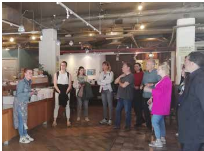
Οι εταίροι του έργου ATL κατά την επίσκεψη στο VEPA

Οι εταίροι από την Ισπανία, την Ελλάδα, την Ιταλία, την Πολωνία και το Ηνωμένο Βασίλειο έφυγαν από την Φινλανδία με την επιθυμία και την πρόθεση να προωθήσουν όλο και περισσότερο τον ρόλο του ομότιμου και του ειδικού από εμπειρία στον τομέα της έλλειψης στέγης, και στις δικές τους χώρες.